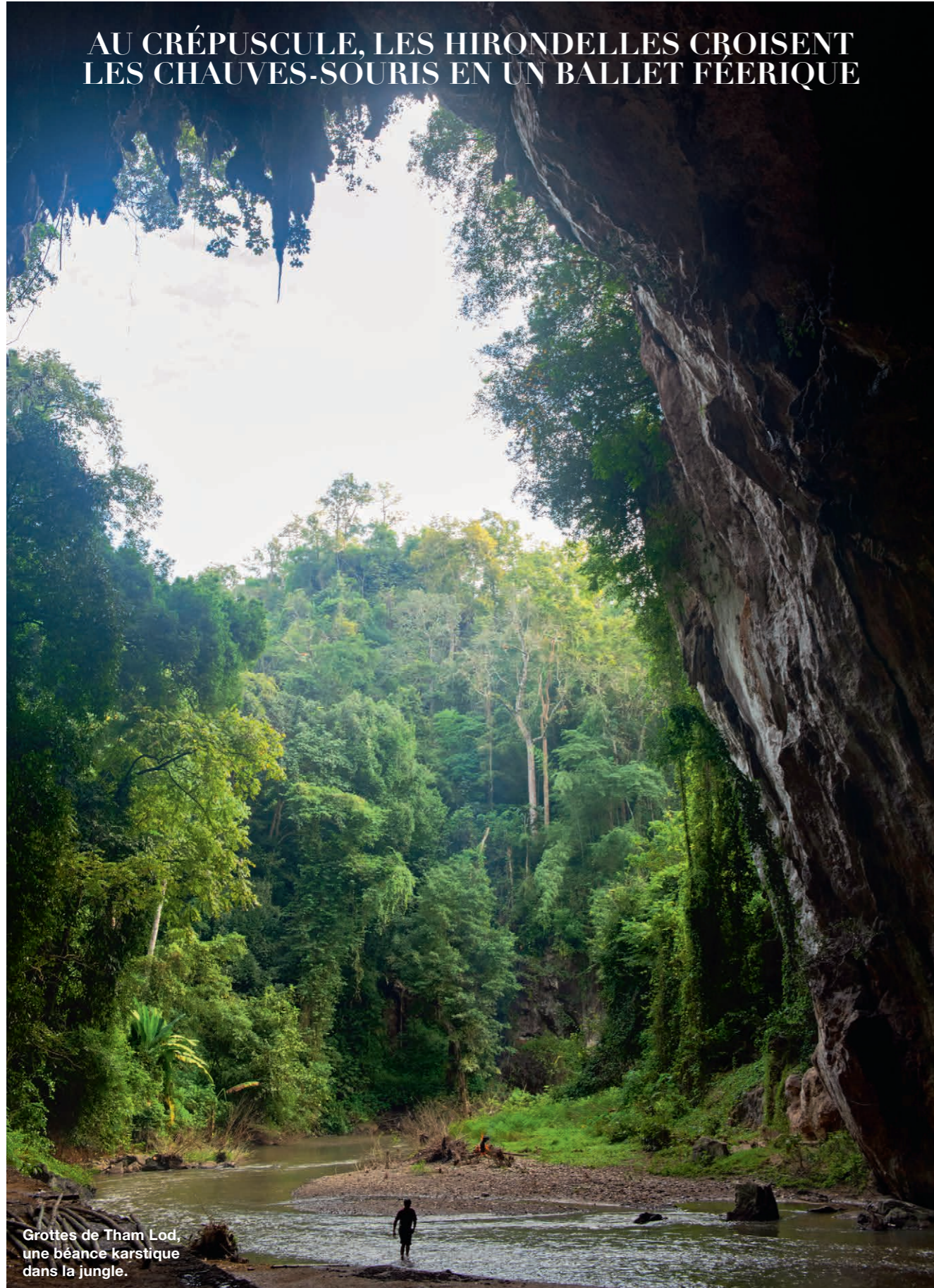
Grottes de Tham Lod, une béeance karstique dans la jungle.