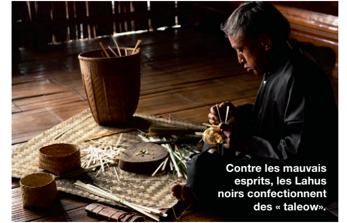
Contre les mauvais esprits, les Lahus noirs confectionnent des « taleow ».