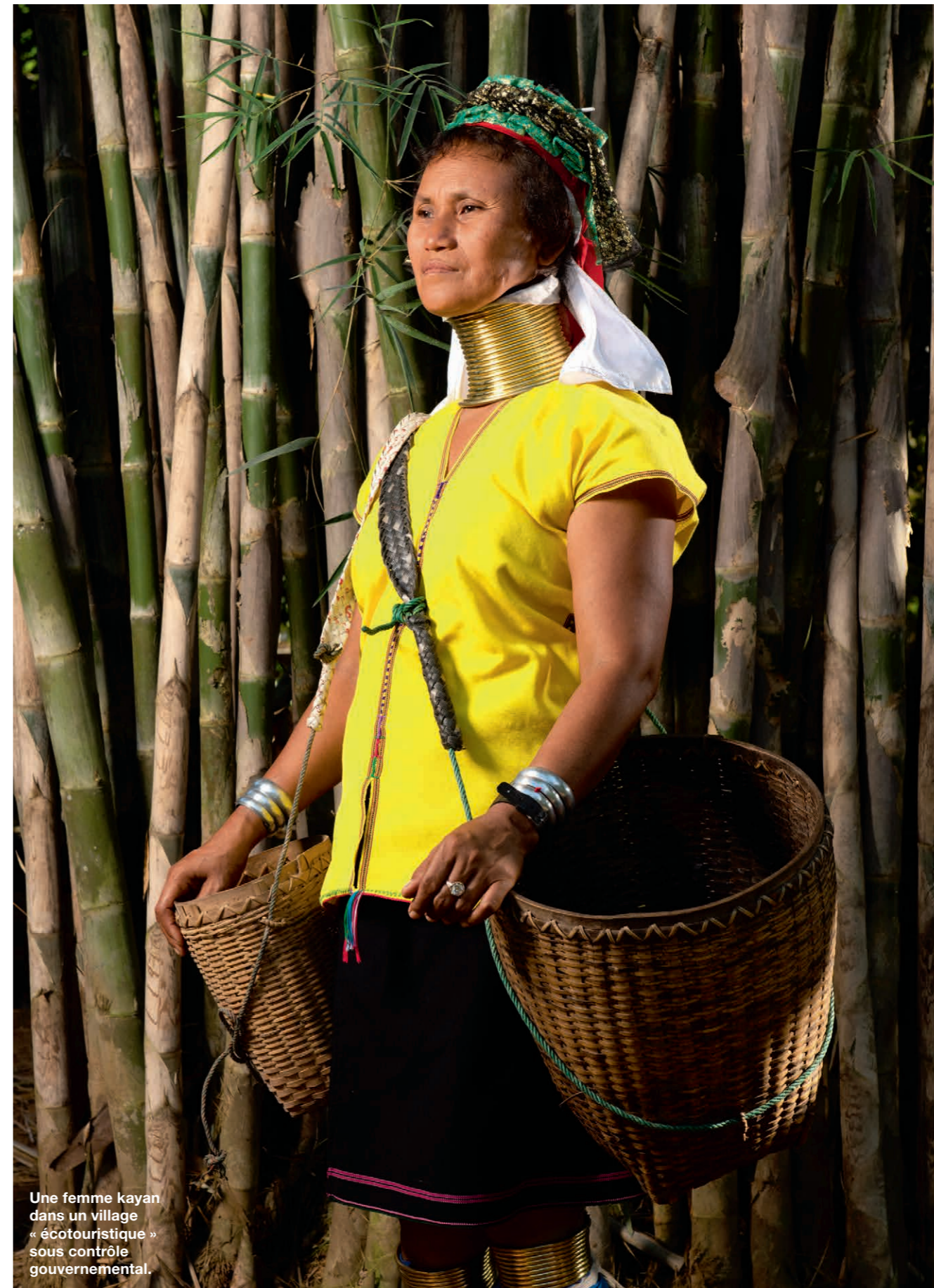
Une femme kayan dans un village « écotouristique » sous contrôle gouvernemental.

or cuivré que leur robe. Les sanctuaires ruissellent de pignons et de statues. L'encens saturé l'air du soir. Tout devient d'un or profond sur le ciel bleu nuit. On songe inévitablement à la pagode Shwedagon, le sanctuaire bouddhique le plus sacré du Myanmar (ex-Birmanie). Au nord de Chiang Mai, le bouddhisme se fait plus kitsch. Dominant les rizières, le temple de Wat Ban Den fait pleuvoir les pierres colorées et les éclats de miroir sur une foule de monstres serpentins (les nagas ), d'éléphants à trois têtes, de paons et de dragons. Un immense bouddha couché, sur le point d'entrer au nirvana, sourit avec nous de ce bestiaire fantastique. Les visiteurs aisés de Bangkok financent ce temple, que fréquentent aussi les campagnards des alentours, bien plus modestes. Ceux-ci appartiennent à différentes ethnies : Karens, Shans, Kayans, Akhas, Lisus, Lahus... Ces populations vivent sur les collines et les montagnes couvertes de forêts qui remplacent les plaines à riz lorsqu'on se dirige vers le nord-ouest du pays. La chaîne de montagnes en bordure du Myanmar présente une orientation nord-sud qui a favorisé les mouvements de population et les échanges commerciaux. Un néophyte se perdra à démêler les origines de ces populations austro-asiatique, tibéto-birmane, karen et mia-yao. Retenons simplement que la province de Mae Hong Son,