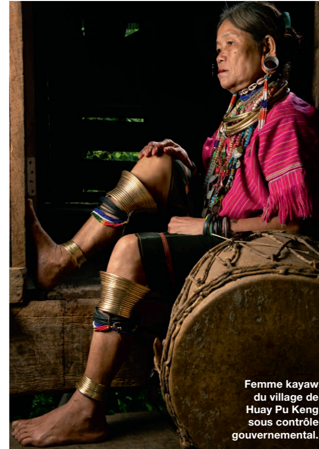
Femme kayaw du village de Huay Pu Keng sous contrôle gouvernemental.