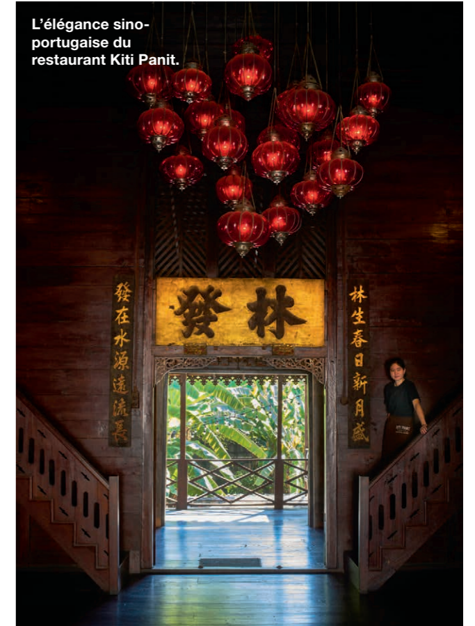
L'élégance sino-portugaise du restaurant Kiti Panit.