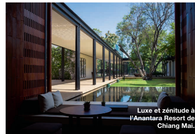
Luxe et zénitude à l'Anantara Resort de Chiang Mai.