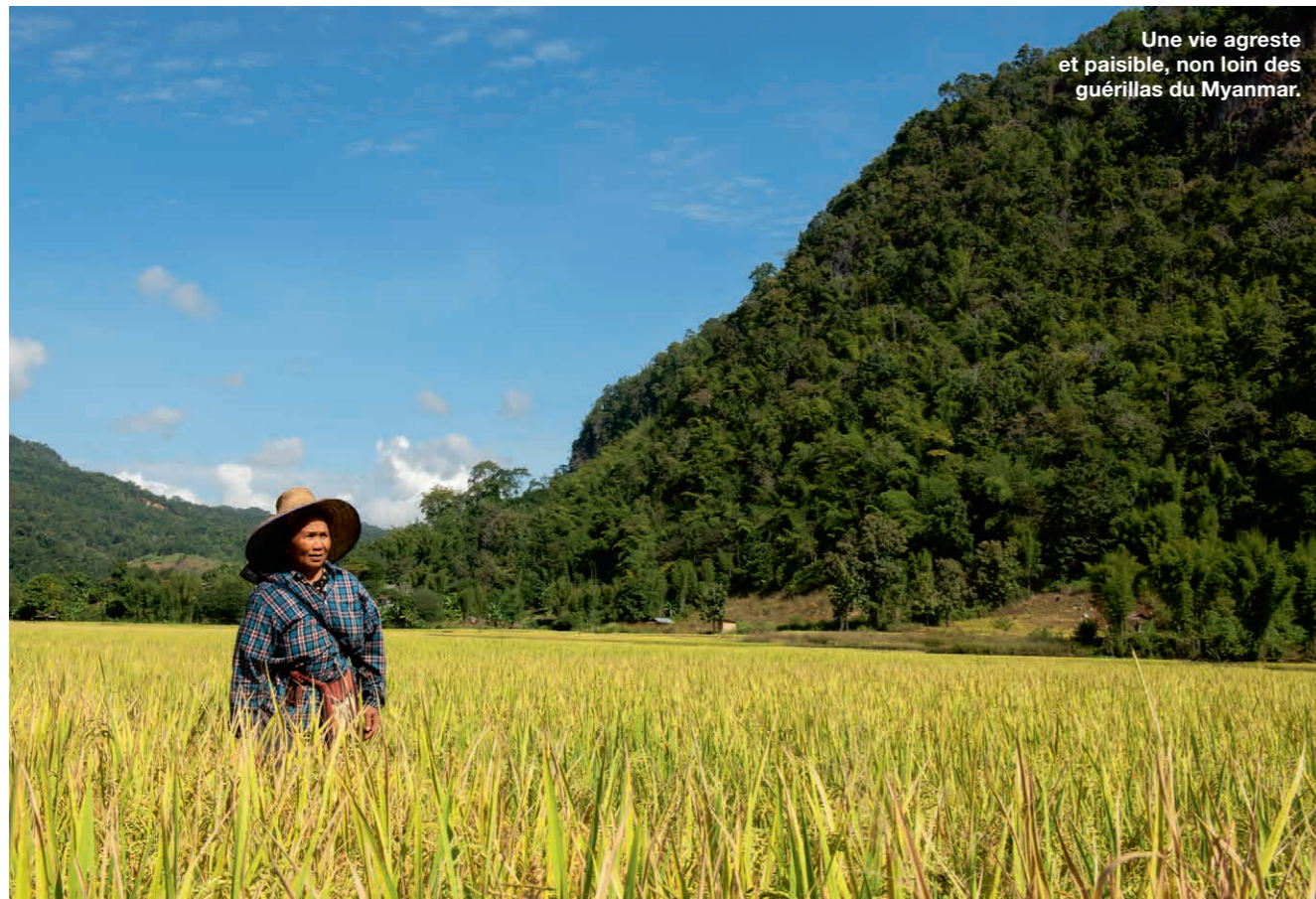
Une vie agreste et paisible, non loin des guérillas du Myanmar.