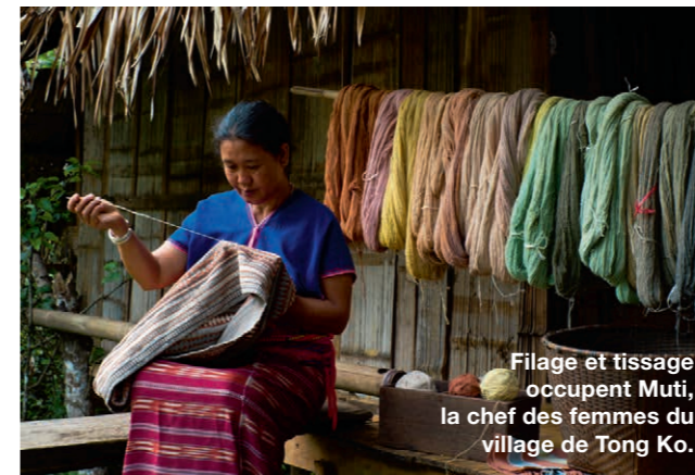
Filage et tissage occupent Muti, la chef des femmes du village de Tong Ko.