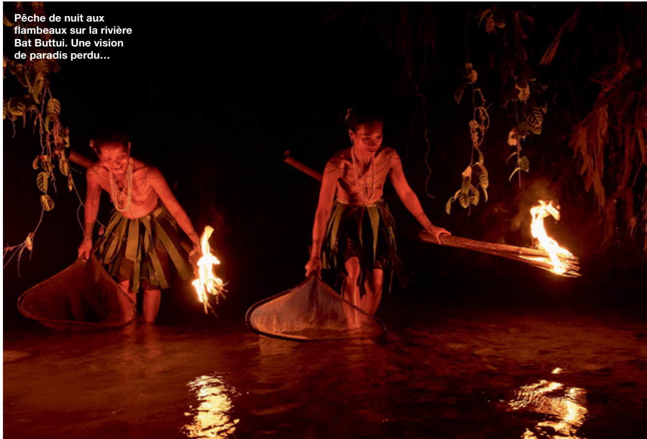
Pêche de nuit aux flambeaux sur la rivière Bat Buttui. Une vision de paradis perdu...