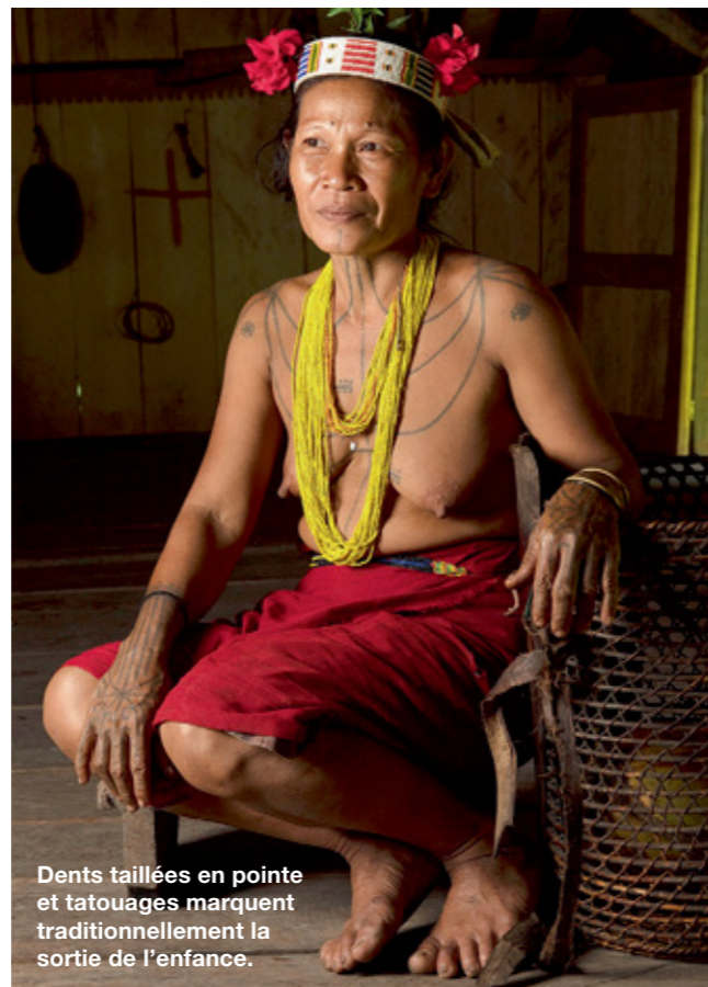
Dents taillées en pointe et tatouages marquent traditionnellement la sortie de l'enfance.