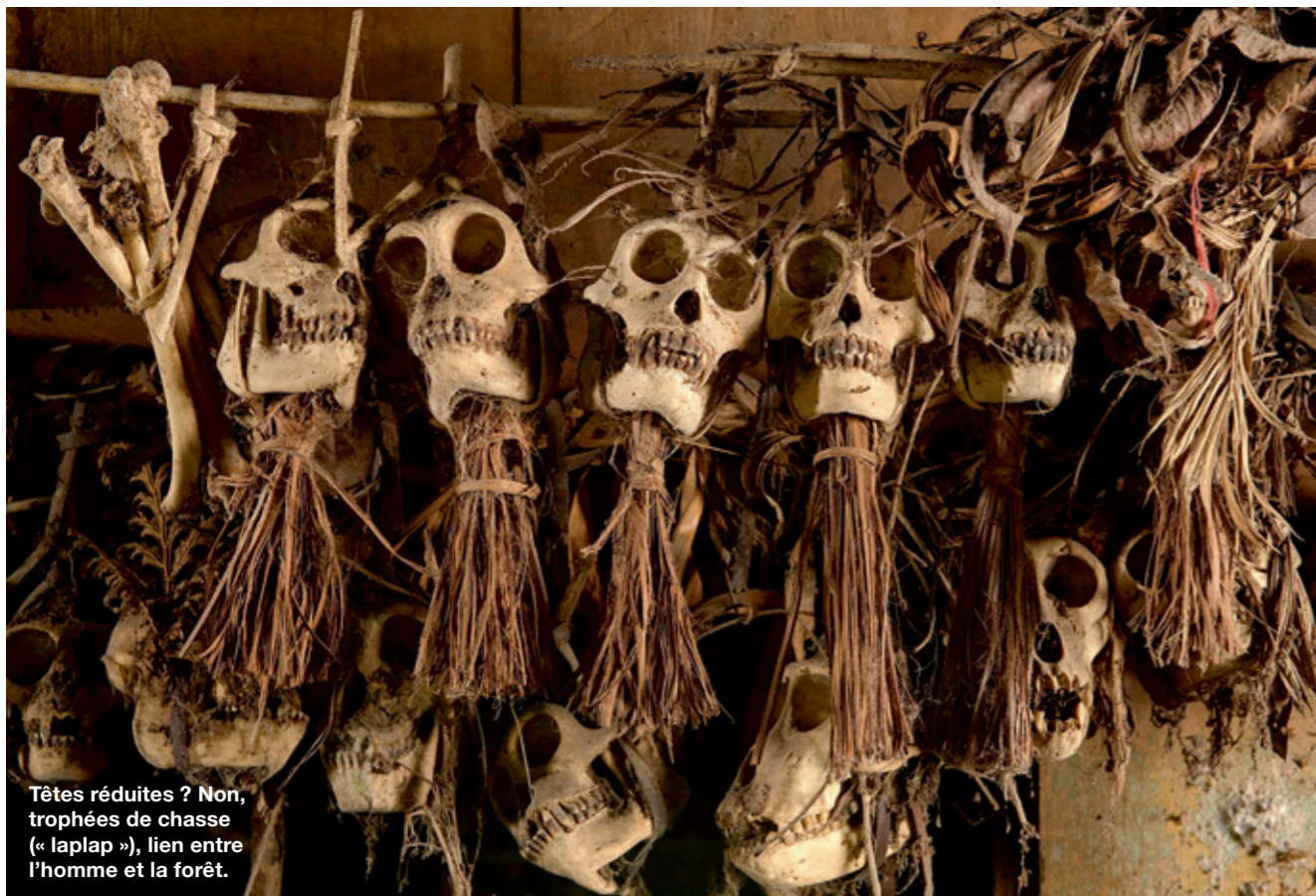
Têtes réduites ? Non, trophées de chasse (« laplap »), lien entre l'homme et la forêt.